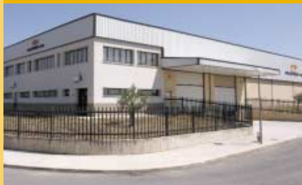
Usine d'Industrias OGI S.L. a Estella. Fabbrica di Industrias OGI S.L. a Estella.

Nel corso di questi quattro decenni siamo cresciuti in quantità e qualità produttiva, in professionalità del nostro staff umano, in tecnologia propria, ecc.