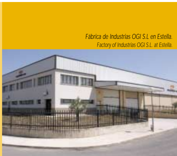
Fábrica de Industrias OGI S.L. en Estella. Factory of Industrias OGI S.L. at Estella.

These four decades have seen continuous growth - in the quantity and quality of our production, in our staff expertise and in our technological innovation.